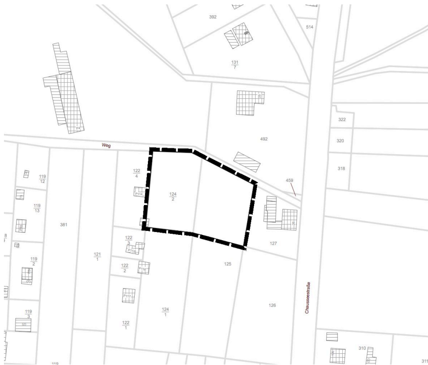
Abb. 2: Geltungsbereich