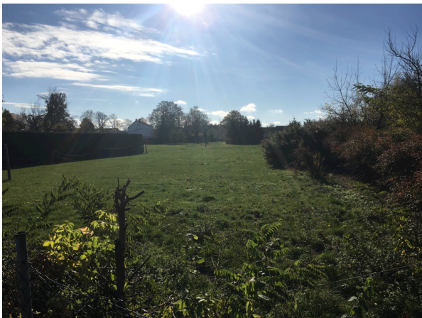
Abb. 5: Pferdekoppel

Um das Plangebiet (westlich, östlich und nördlich) ist bereits Bebauung vorhanden; nördlich verläuft eine schmale Anliegerstraße. Der Ergänzungsbereich wird derzeit als Pferdekoppel genutzt. Aufgrund der intensiven Beweidung lässt sich das Auftreten streng geschützter Pflanzenarten ausschließen. Im nördlichen und westlichen Teil Flurstücks 124/2 hat sich eine Brennesselflur entwickelt. Die Koppel ist - einschließlich der Brennesselflur - mit einem Elektrozaun eingezäunt, zusätzlich zur Straße hin mit einem Maschendrahtzaun. Zwischen den beiden Flurstücken ist eine Hecke ausgebildet, diese soll erhalten bleiben.