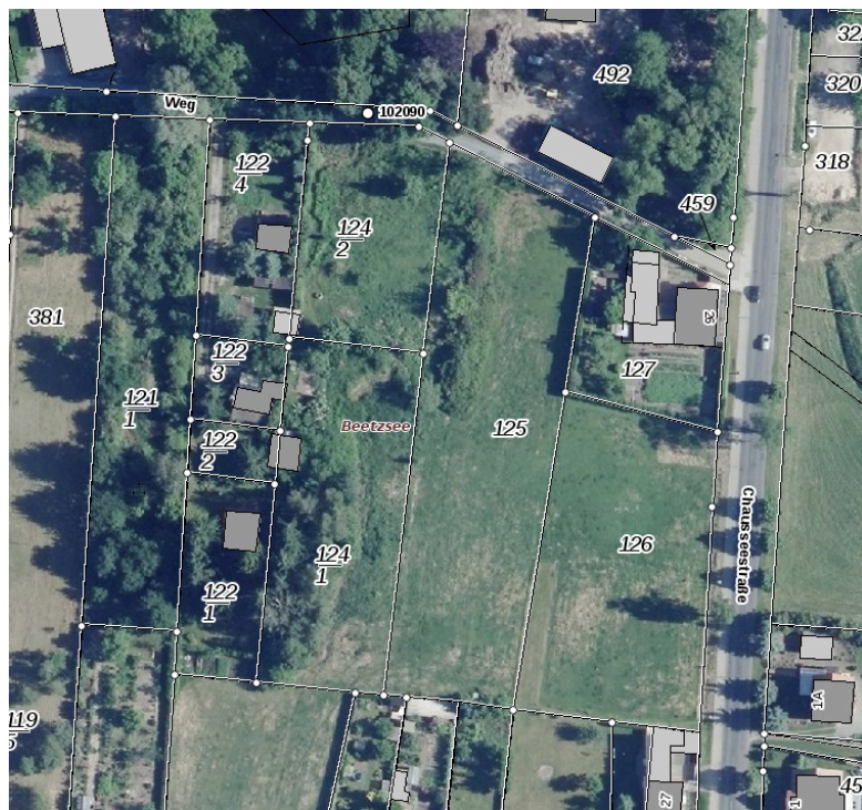
Abb. 3: Luftbild