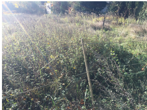
Abb. 6: Brennesselflur

im südlichen Bereich des Fst. 124/2 sind 4 Laubbäume vorhanden.