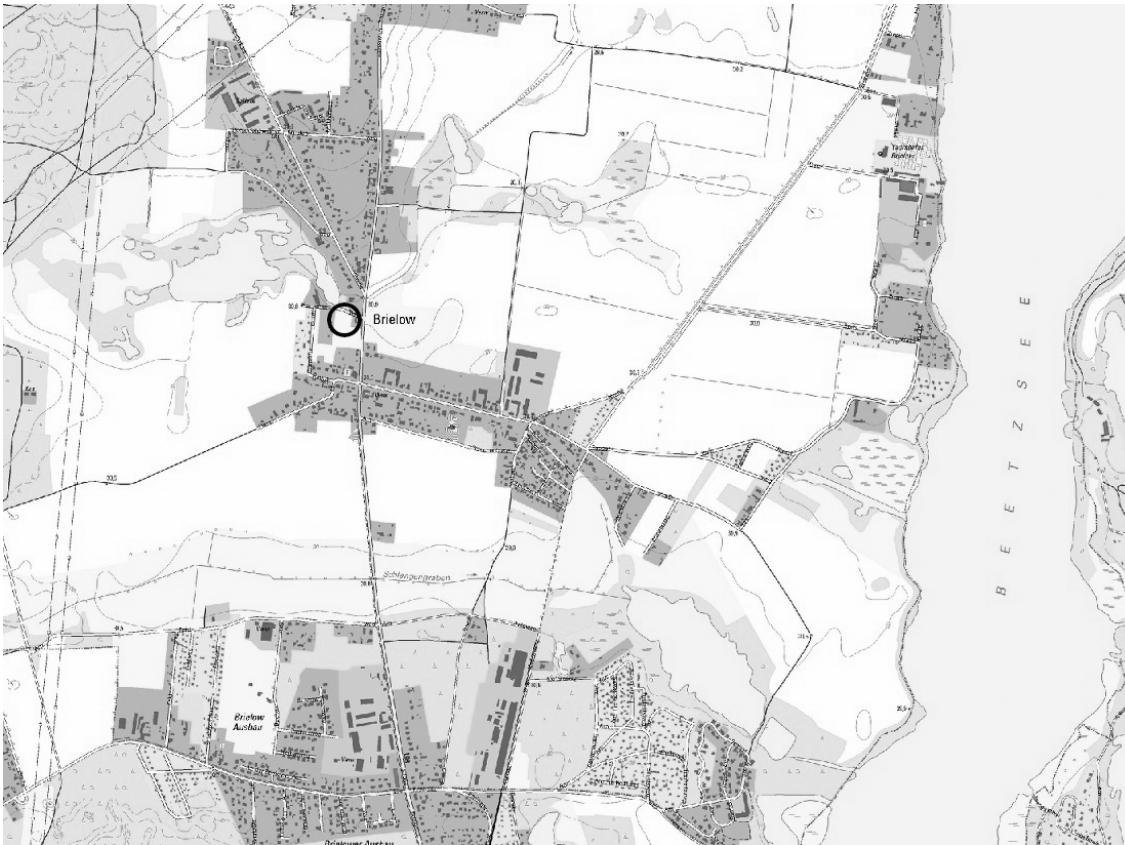
Abb. 1: Übersichtsplan

Die Ortslage Brielow kann als Straßendorf mit ländlicher Bebauung bezeichnet werden. Der Ortskern wird durch Wohnen, Gewerbebetriebe und landwirtschaftliche Hofstellen mit wenigen gewerblichen Nutzungen gekennzeichnet. Die Einwohnerzahl der Gemeinde Beetzsee beträgt 2.501 mit Stand 31.12.2014 (Quelle: Amt für Statistik Berlin-Brandenburg). Die Baustruktur von Brielow wird durch eine dörfliche Bebauung mit Drei- und Vierseithöfen sowie straßenseitiger Wohnbebauung mit großen rückwärtigen Gartengrundstücken geprägt.