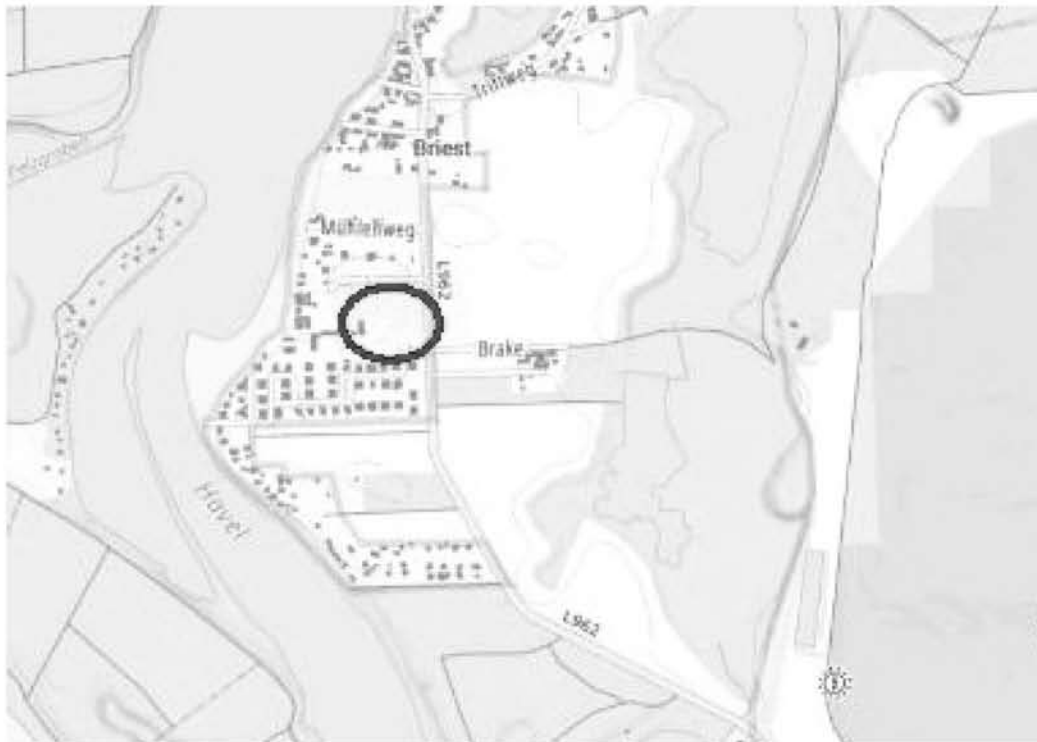
Abb. 1: Übersicht mit Darstellung der Lage des Plangebiets, ohne Maßstab